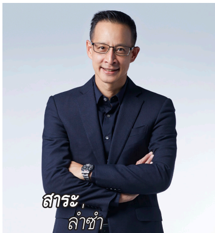
สาระ ล่ำขำ

ล่าสุด เมืองไทยประกันชีวิต ได้เปิดตัวผลิตภัณฑ์ใหม่ “โครงการเหมาจ่าย เอ็กซ์ตรา” ที่โดดเด่นเรื่องความคุ้มครองสุขภาพที่ช่วยให้คลายกังวลเรื่องค่ารักษา อุ่นใจได้เพราะดูแลตั้งแต่บาทแรกที่เข้าพักรักษาตัว ด้วยความคุ้มครองแบบเหมาจ่ายตามจริง ครอบคลุมทั้งกรณีเจ็บป่วยและกรณีผ่าตัดด้วยการเข้ารักษาในฐานะผู้ป่วยใน ทั้งโรคร้ายแรงและโรคทั่วไป รวมสูงสุด 500,000 บาท